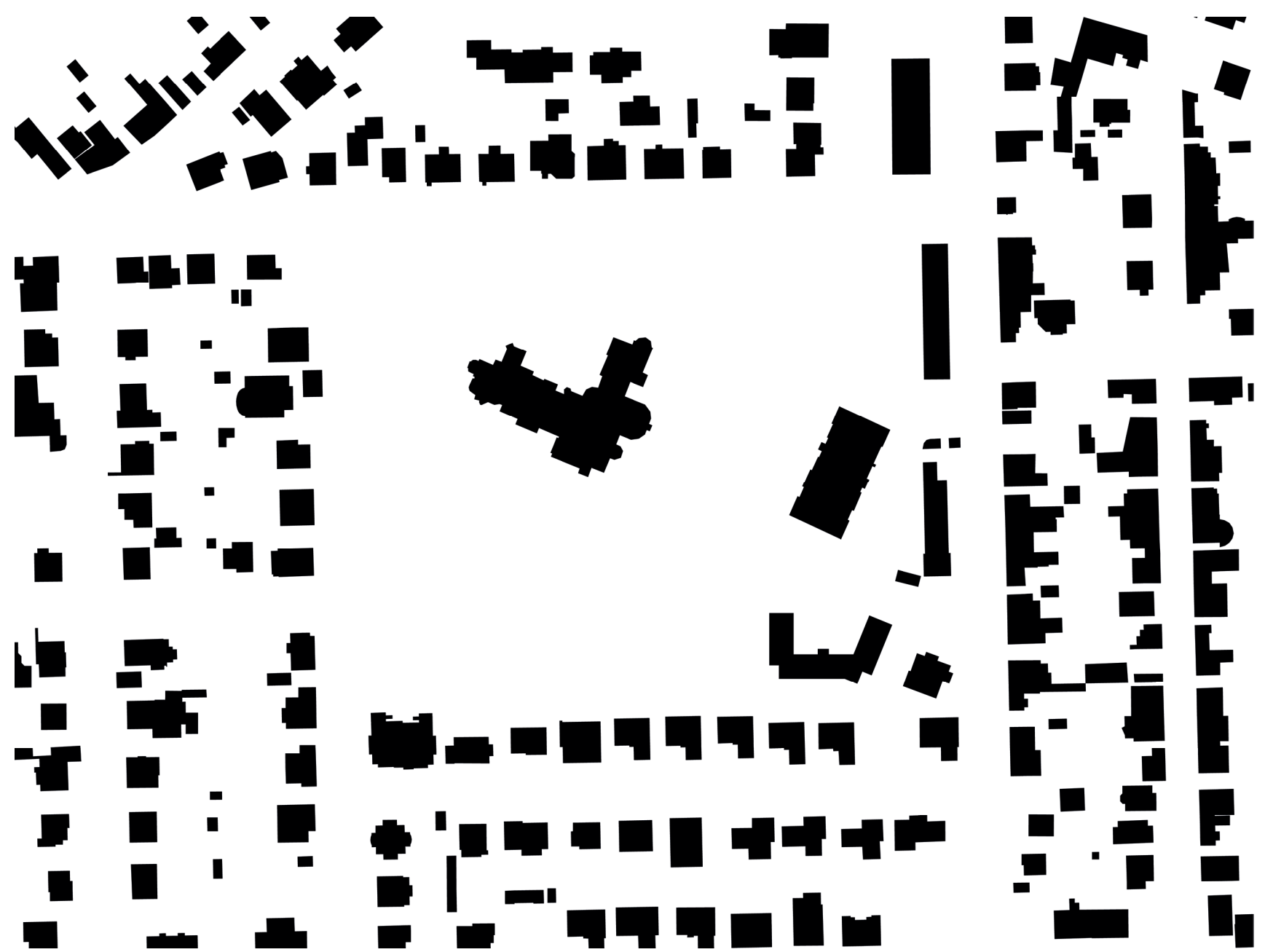
Schwarzplan | 1:2000

u jakékoli cenové kategorie. Ovšem v případě nutnosti koncept umožňuje snadné zřízení parkovacích ploch kolem vstupní části areálu. KONSTRUKCE - Každý trakt má pravidelný modulový systém. Jedná se o příčný stěnový skelet, který může být z prefabrikovaného betonu nebo případně z dřevěných CLT panelů. PARK - Oleř dle podkladů kácíme pouze při stávajících stromů. Pozemek je rozdělen na vstupní dvůr, sdílenou partii a část pojednanou jako park pro procházky s lavičkami a mlátovými chodníky. V jižozápadním cípu se nachází prostor pro zahradničení.